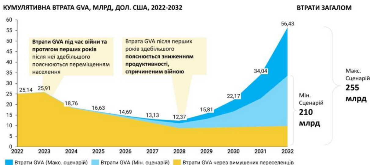
Рисунок 3 – Оцінювання втрат валової доданої вартості через негативний вплив війни на людський капітал України