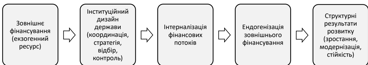
Рисунок 1 – Логіка інтерналізації зовнішнього фінансування в національній економічній системі

Важливим додатковим елементом інституційного дизайну інтеграції зовнішнього фінансування є механізми страхування ризиків. Йдеться про страхування інвестиційних, кредитних, політичних, воєнних та інфраструктурних ризиків, які можуть стримувати залучення зовнішнього капіталу. Використання страхових інструментів сприяє зниженню невизначеності для міжнародних фінансових організацій, банків та приватних інвесторів, підвищує доступність фінансових ресурсів і розширює можливості реалізації довгострокових проєктів розвитку. Для країн із підвищеним рівнем ризику, зокрема України, страхування може виступати важливим інструментом інтерналізації зовнішнього фінансування та посилення економічної стійкості.