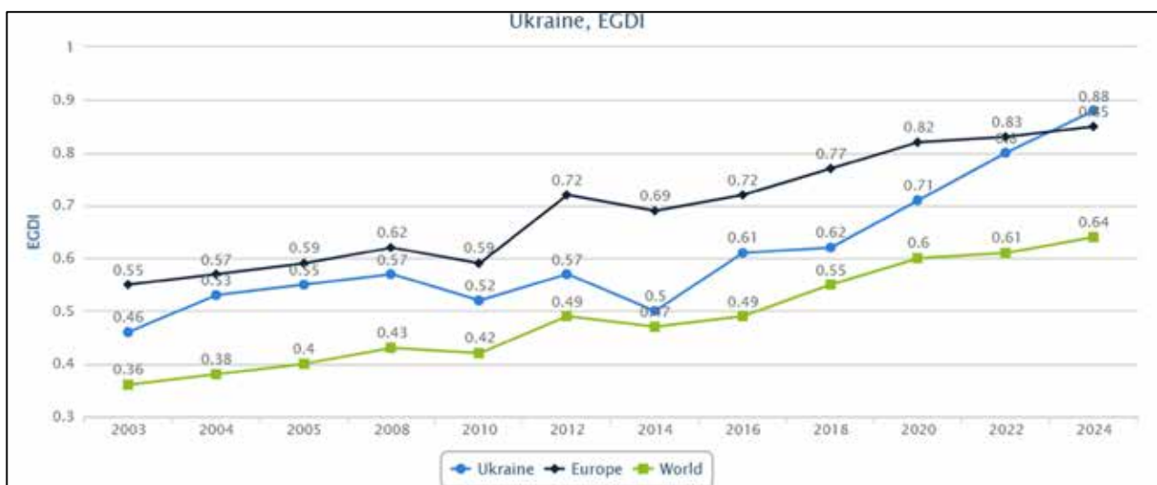
Рисунок 1 – Динаміка рейтингових показників України у E-Government Development Index (EGDI) за 2003-2024 роки Джерело: [1]

Саме тому цифровий розвиток національної економіки слід розглядати як результат когнітивної та системної інтеграції інформаційно-комунікаційних технологій (ІКТ) у всі процеси суспільного відтворення та управлінські вертикалі. Сучасні наукові підходи трактують цифрову економіку як багатомірне середовище, у межах якого визначальними чинниками розвитку виступають масиви даних (Big Data), цифрові