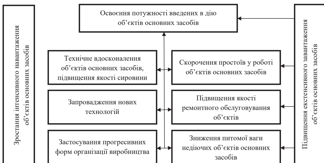
Рисунок 3 – Напрямки підвищення ефективності використання основних засобів у ПрАТ «Геофіпольський цукровий завод»

Висновки. Поліпшення показників ефективності використання основних засобів суб'єкта господарювання впливає на фінансові результати його роботи за рахунок зростання випуску продукції, зменшення її